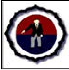
Associação de Árbitros de Judo de Portugal